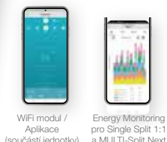
WiFi modul / Aplikace (součástí jednotky) Energy Monitoring pro Single Split 1:1 a MULTI-Split Next