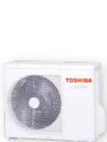
Venkovní jednotka (příklad)